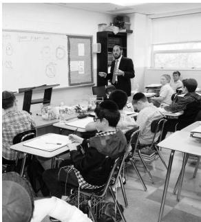
Se espera ahora que hagamos exactamente lo que hicimos por el maestro exigente: trabajar duro, esforzarse por algo, eventualmente tener éxito y mejorar aún más.