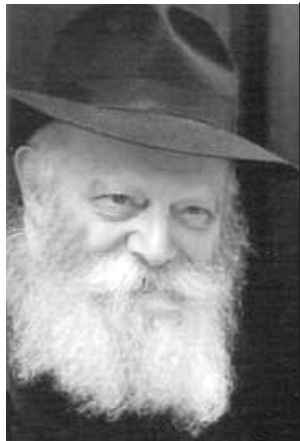
de las palabras del Rebe de Lubavitch

¿Qué Aprendemos esta Semana de la Parshá?